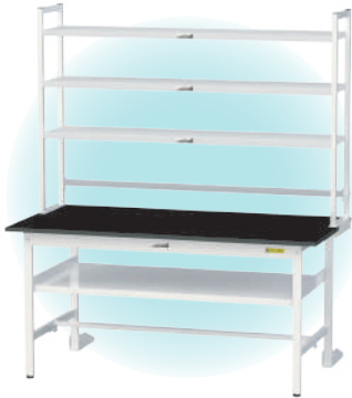
SLK-1575F-BKW + LS-1510-W + LS-1500T(2 枚)