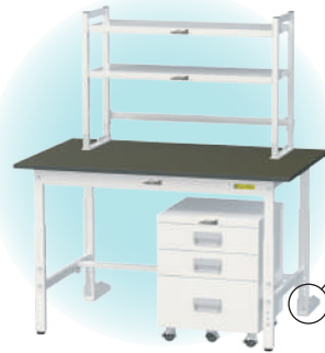
SLKA-1275-BKW + LS-0906-W + LS-900T(1 枚) + UCW-3