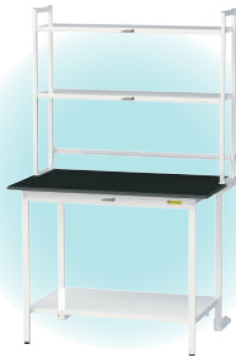
SLKH-1275TT-BKW + LS-1210-W + LS-1200T(1 枚)